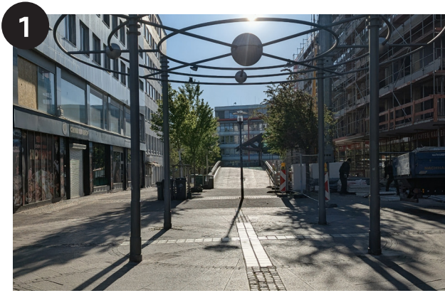
Treffpunkt Kreuzung Viehofer Straße / Pferdemarkt