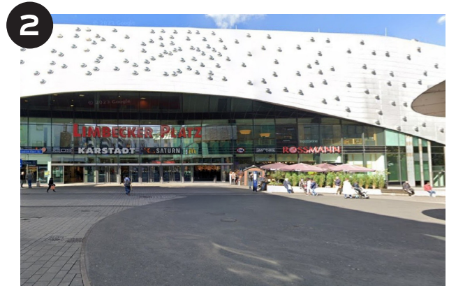
Treffpunkt Haupteingang Innenstadt des Einkaufszentrum Limbecker Platz (Ecke Friedrich-Ebert-Straße / Limbecker Straße)